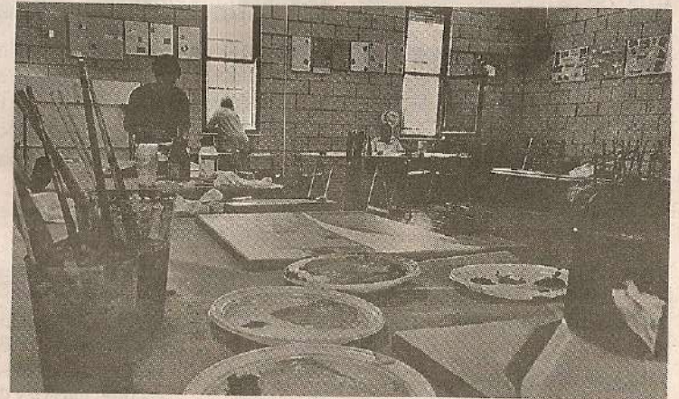
El rincón de Morales donde los pintores contemporáneos crean sus cuadros.