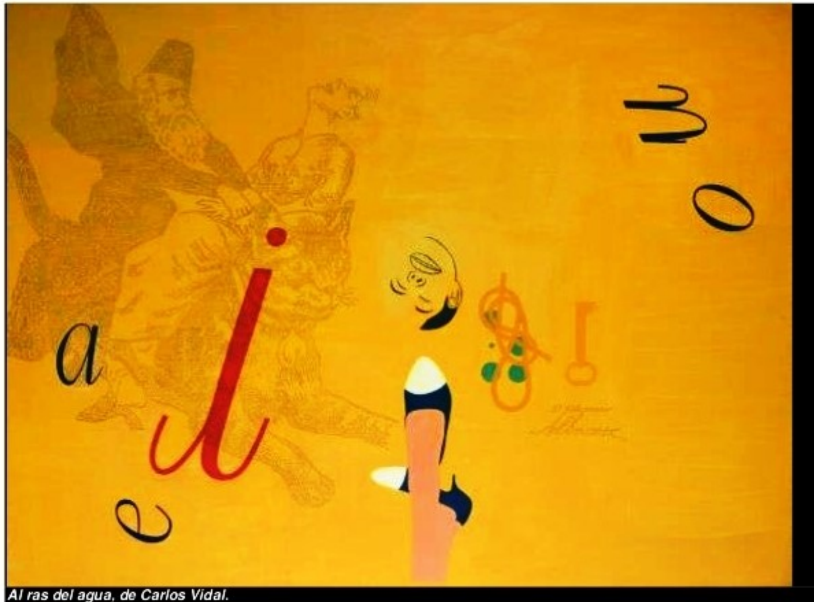
Al ras del agua, de Carlos Vidal.

“El mar lo es todo, más si está uno en medio de él; son tantas cosas, dependiendo por qué estás ahí. ¡Qué pena que ya no se pueda viajar en barco! Me refiero a cruzar los mares”, señala en entrevista por correo electrónico. Agrega que con su obra no desea transmitir nada: “Tan solo expongo; si usted dice mar-agua, cada quién tendrá sus sueños, sus fobias, sus recuerdos; mi trabajo es proponer que cada uno cargue con su sayo”.